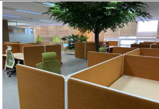
AI Coworking Space 전경